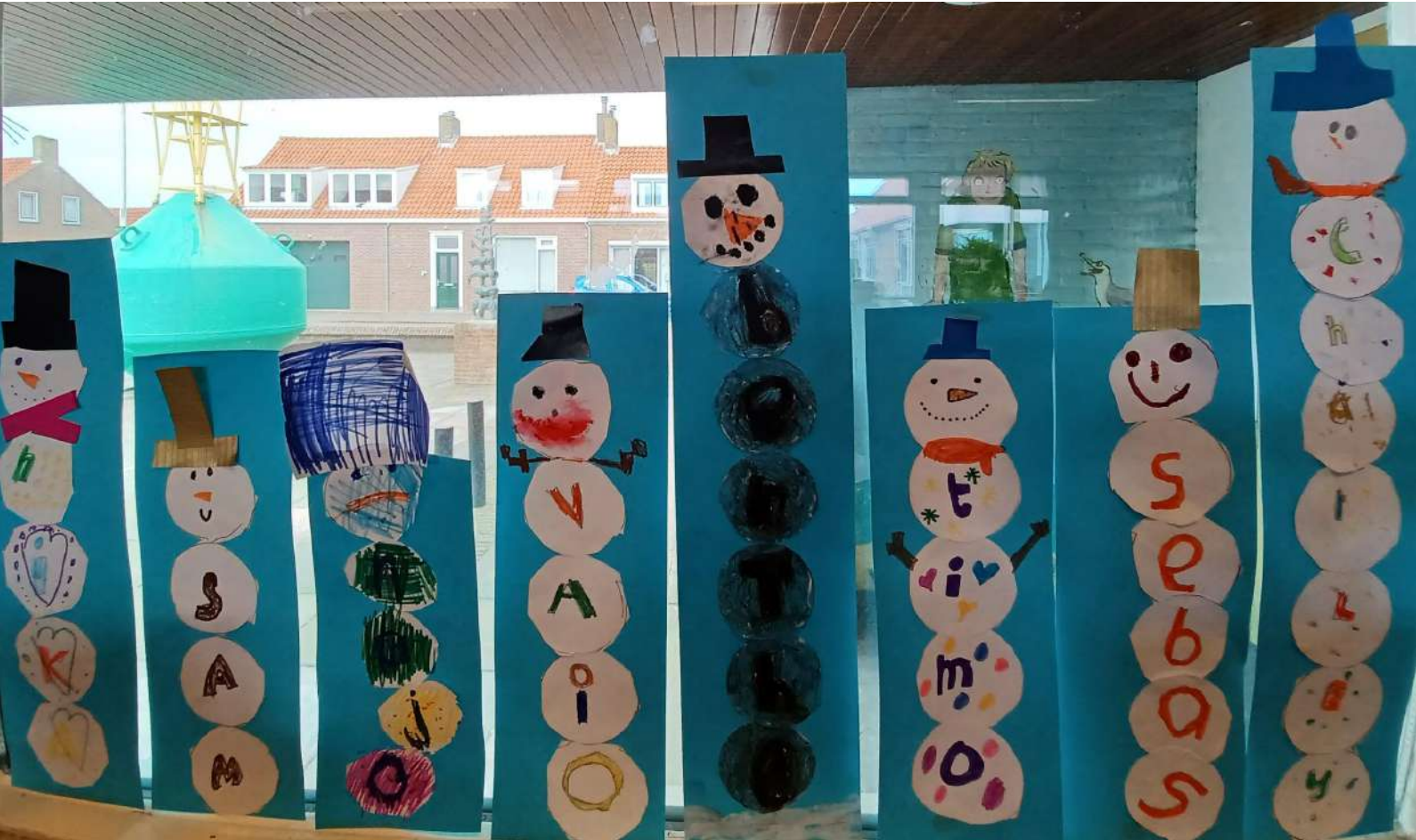
De sneeuwpoppen van groep 3/4