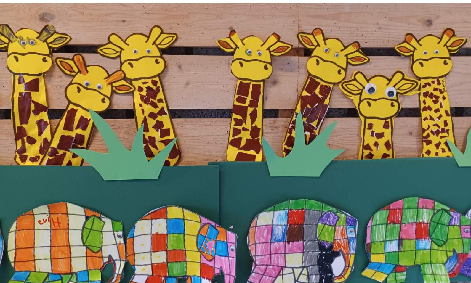
Thema dieren Groep 1/2